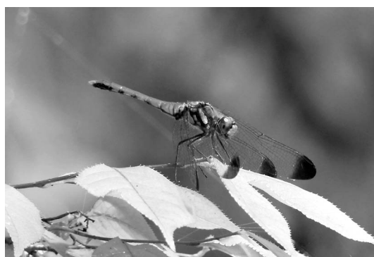
図14：リスカカネ♂胸部黒条発達 富山市(大沢野町)岩木新 2022.8.2.