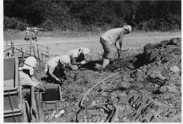
写真2 露頭での調査風景

風化をふせぐためシートで覆われている 今回の調査は写真左側の部分