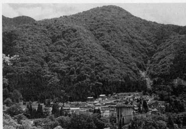
図2 平村祖山の雪持ち林

こうした雪持ち林の維持は、決して容易なものではありませんでした。小雪の年が何年も続くと雪崩の恐ろしさがつい忘れられ、それに経済的な理由などが加わって雪持ち林も伐採されることがありました。現在の雪持ち林が、集落を守るための最小限の大きさとどまっているのはその影響もあると考えられます。伐採のため、終戦前には大雪の年に民家が襲われる雪崩災害も起こりました。こうした手痛い代償を受けながら、長年月の