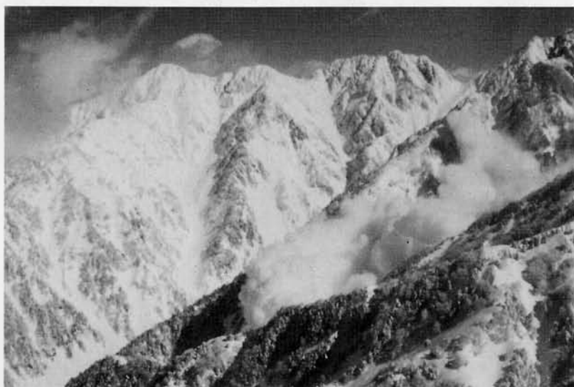
図1 剱岳池ノ谷を流下するホウ雪崩

急流で落差が大きく水量が豊富な河川を多く抱える富山県では、昔から水力発電の電源開発が盛んに行われてきました。周知のように黒部峡谷には多くのダムや発電所がつくられています。こうしたダムや発電所の建設工事に際して、渓谷内にあるわずかな平地やトンネルの出口など必ずしも雪崩に対して十分安全でない場所に工事用宿舎が建てられました。冬でも多くの作業員が居住する宿舎が雪崩に襲われると、一度に多数の犠牲者が出ます。