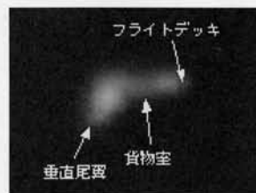
スペースシャトルの写真