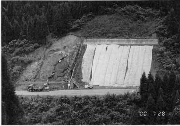
写真1 恐竜足跡化石群露頭

風化をふせぐためシートで覆われている 今回の調査は写真左側の部分