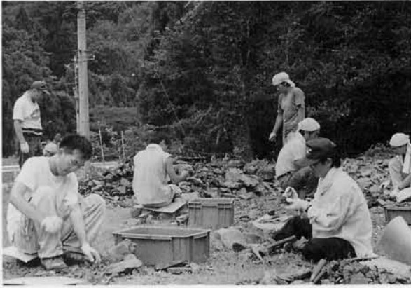
写真3 広場での調査風景