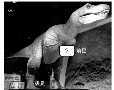
ティラノサウルス