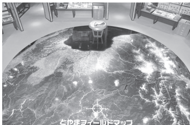
とやまフィールドマップ（富山県衛星写真）