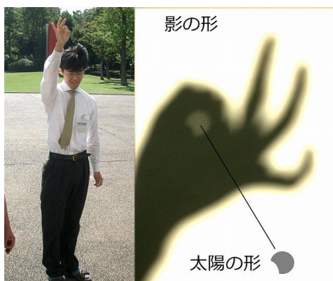
親指と人差し指で穴をつかって、太陽の欠け具合をみてみよう 2004年10月14日撮影