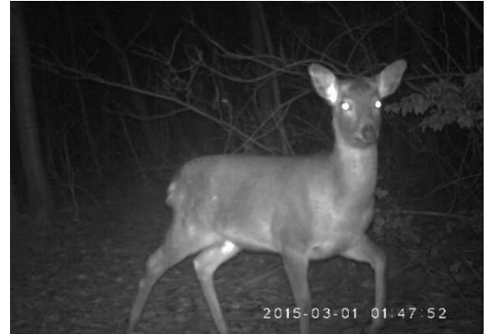
図1.夜間、自動カメラに写ったニホンジカ

ニホンジカは草地と森がある山地で生活し、全国的に増えています。様々な植物の葉や木の皮を群で食べるため、日本各地で様々な問題がおきています。農業や林業の被害(農作物が食べられ、木の皮を食べるため木が枯れる)、林の下にはえる植物が減少し、時には土壌が流出する、夏に高山へ移動して高山植物を食べる、などです。県内でも徐々に増え、農業や林業への被害が少しずつ見られるようになり、今後の増え方や分布の広がりには注意が必要です。(南部久男)