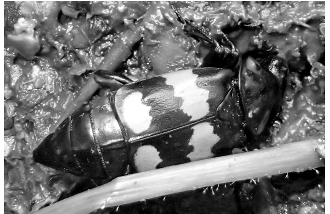
図10 ツノグロモンシテムシ