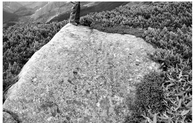
図3 氷河削痕と考えられる溝

薬師沢～カベツケヶ原間の登山道から薬師岳東南尾根の西側に発達するカールを確認した．祖父岳～雲ノ平のスイス庭園の登山道沿いで，安山岩質の溶岩上に氷河削痕と考えられる幅約3 cm，長さ約100～150 cmの溝を発見した（図3）．