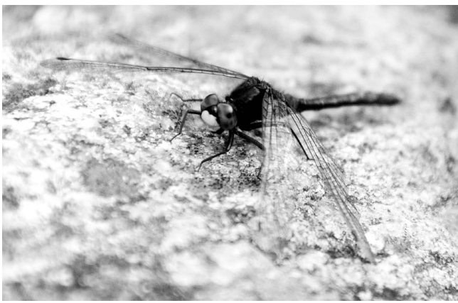
図8 カオジロトンボ