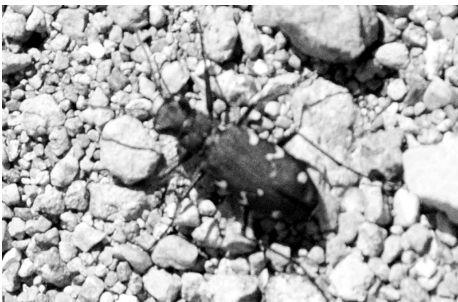
図9 ミヤマハンミョウ