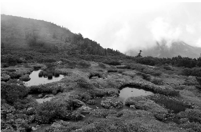
図2 雲ノ平の池塘群

雲ノ平の溶岩台地とその上に広がる池塘群を確認した（図2）．祖父岳から雲ノ平間の登山道中に板状節理が発達する安山岩を確認した．