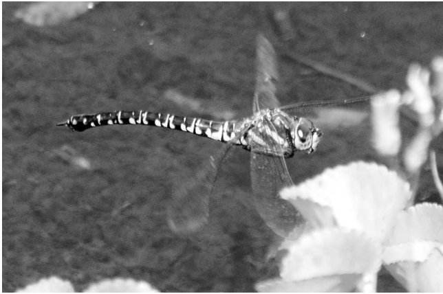
図7 オオルリボシヤンマ