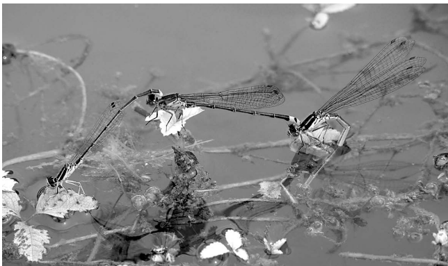
図3 アジアイトトンボ♂とクロイトトンボ♀の異種間3連結 富山市(八尾町)西神通 2017年6月18日.