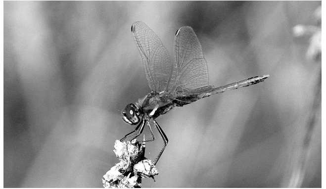
図5 スナアカネ 黒部市堀切 2017年10月11日.