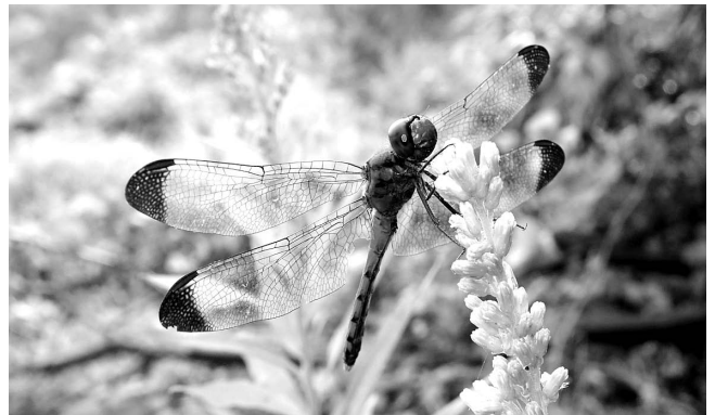
図6 胸部黒条が一部消失したコノシメトンボ♂ 富山市(大沢野町)小羽 2017年10月10日.