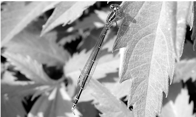
図2 胸部淡色条の発達したクロイトトンボ♀ 富山市(婦中町)上轡田 2017年5月30日.