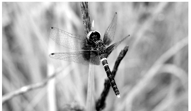
図7 ハッチョウトンボ♂黒化型 富山市(婦中町)葎原 2017年5月25日.