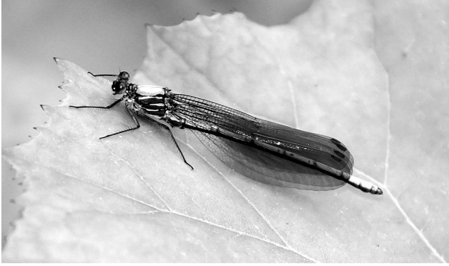
図1 アサヒナカワトンボ橙色翅 高岡市(福岡町)沢川 2017年5月10日.