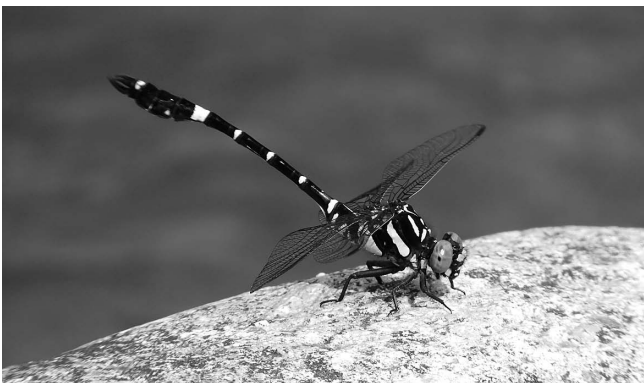
図4 オナガサナエ♂西日本型 富山市(大沢野町)小黒 2017年8月2日.