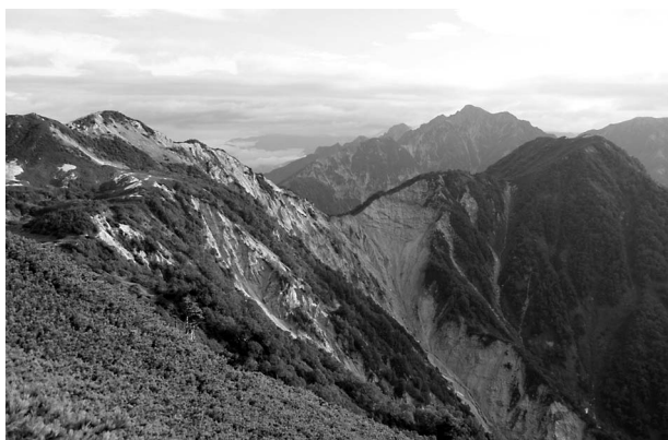
図3 南沢乗越の大規模崩落地。