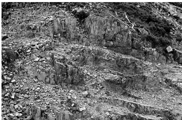
図4 層理面がほぼ垂直になったカルデラ湖性堆積物 (爺ヶ岳)。