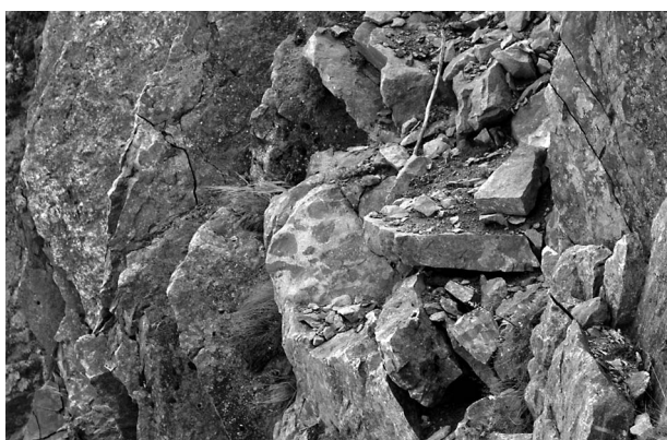
図5 暗色包有物を含む黒部川花崗岩。

オオルリボシヤンマ Aeshna crenata と思われる種 (幼虫) と、アキアカネ Sympetrum frequens (成虫) を確認した。前者は、烏帽子小屋付近の池塘で2個体確認した。後者は、南沢乗越で1個体採集し、種池小屋付近の池塘で1個体撮影した。