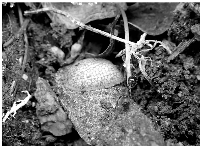
図7 アリスアブの一種の幼虫 (8月27日, 北葛岳).