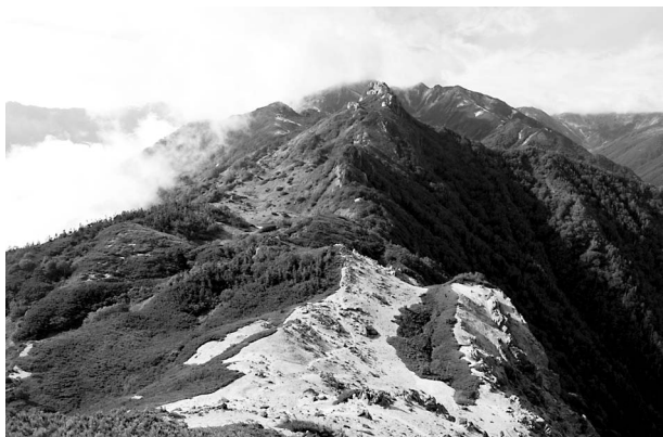
図2 烏帽子岳から南沢岳間に発達する船窪地形。