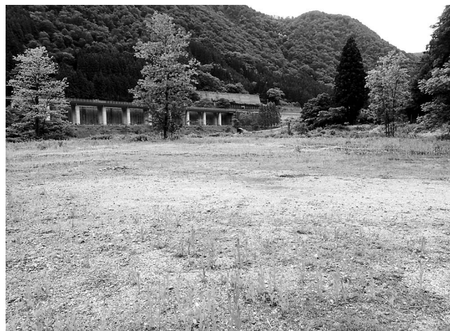
図1 キバネツノトンボが新たに確認された南砺市内の荒地。2022年5月30日撮影。

1)。記録個体は、いずれも荒地縁部に生育する草本類上で静止していた(図2)。荒地全体を徒歩で探索したが、確認されたのは本稿で記録した4個体のみであった。