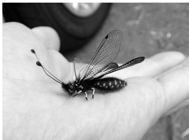
図3 白川村内の岩田(2021)が記録した地点で確認されたキバネツノトンボ♀。腹部が肥大している。