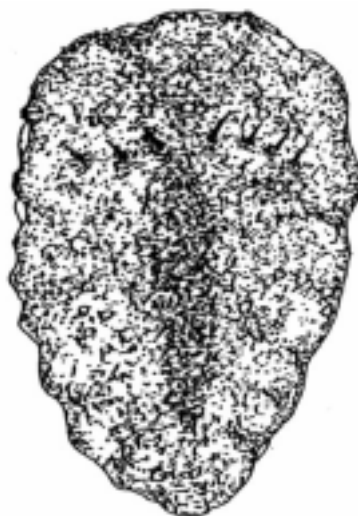
オオツノヒラムシ