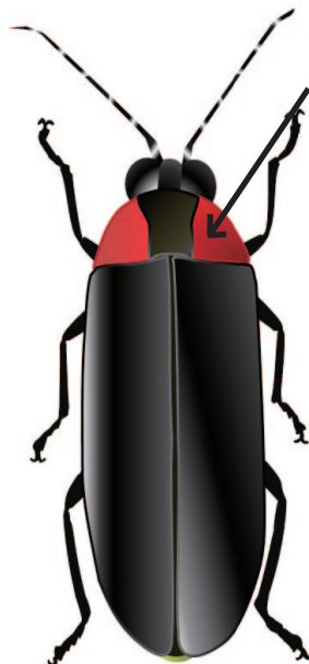
黒いすじが太く 真ん中が少し細い