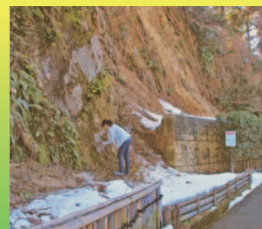
道路沿いの切割り

表面に黒っぽい土が被っていたり、植物が生えてる場合は、少し削って内側の土だけを採取してください。