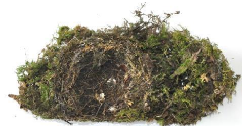
フードの上にあった巣 (2013年)