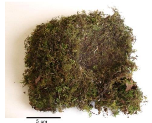
岩のすきまの巣 (2010年)

巣の中で卵をのせるくぼみの産座は、特に大切な場所です。そこには、細くしなやかなコケの胞子体の柄が50~70本も挟みこまれ、居心地の良さそうな場所になっていました。どの巣にも決まったコケと胞子体の柄が使われていました。オオルリはコケを上手に見分けて、巣材に選んでいるようです。胞子体の柄は、他の県で使われていない巣があるので、つがいによっては必ず使うわけではないようです。3つの巣は、場所や巣材、作り方が似ているので、もしかすると同じつがいがつくった巣なのかもしれません。(坂井奈緒子)