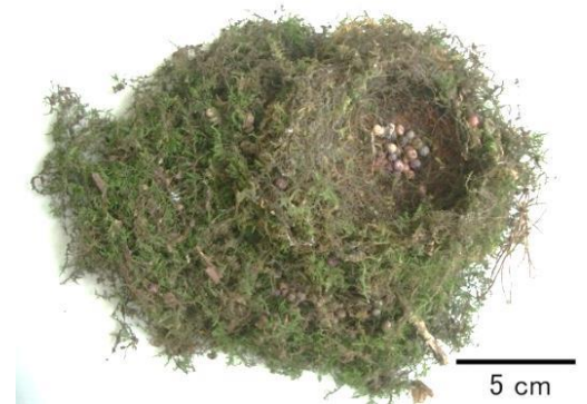
フードの上にあった巣 (2009年)

3つの巣を調べると、材料は主にトヤマシノブゴケで、コケ同士をうまくからませて作ってありました。トヤマシノブゴケは、里山の岩の上や木の根元で見られる大型のコケです。他の県の巣でも使われているので、オオルリはこのコケを好むようです。ちなみに名前につくトヤマは、「富山」ではなく、コケ研究者の「外山」さんが由来です。