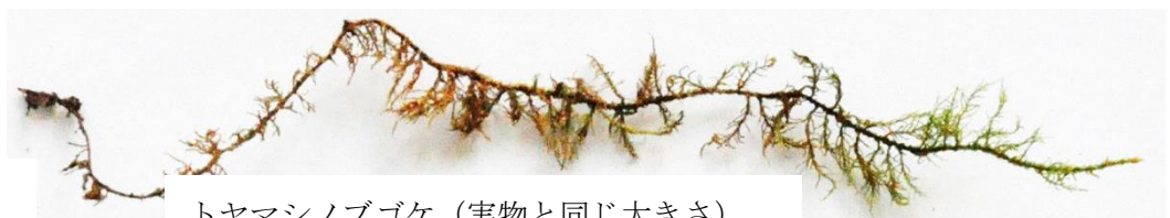
トヤマシノブゴケ (実物と同じ大きさ)