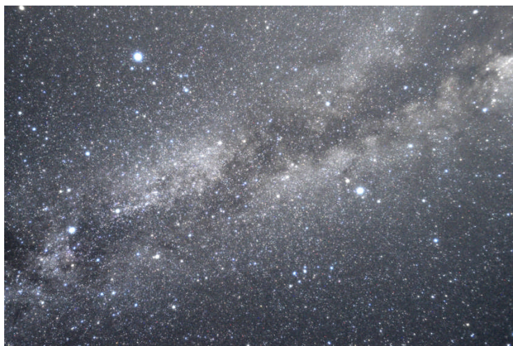
夏の大きな三角形と天の川 (上市町にて撮影)

なお、目がまわりの暗さに慣れるには少し時間が必要です。見つからない場合は3分ほど暗いところにおいて、再び探してみてください。(渡辺誠)