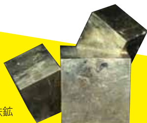
スペイン産 黄鉄鉱