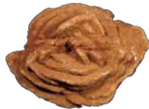
重晶石 (砂漠のバラ)