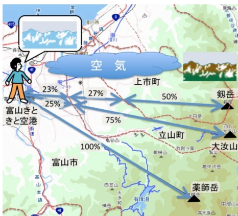
図3 富山きときと空港からみた山の青色

75%富山市 25%、薬師岳は富山市の空気の色 100%、といえますね(図3)。