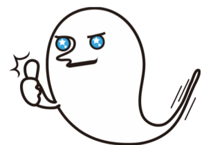
▲オバケのくーきん